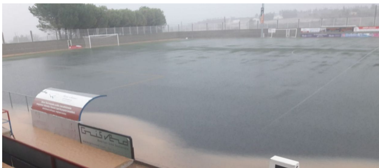
El Municipal de Gandesa, anegat per l'aigua

Els clubs afectats disposen d'una setmana per acordar la data de la recuperació.