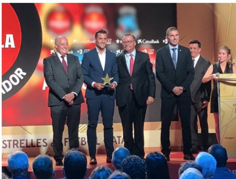
Alex Granell ha guanyat el premi de la Federació Catalana de Futbol al millor jugador de la temporada passada.

per Arnau Segura 16/10/2018 20:13 | Actualitzat a 17/10/2018 11:35