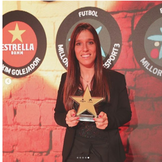
cristinabaudet7 • Seguir Antiga Fàbrica Estrella Damm

cristinabaudet7 Muy Feliz de recibir este premio. Mil gracias a todas esas personas que siempre han confiado en mí y día tras día están apoyándome, sobretodo a mi club @rodespanyol y a toda mi familia. Es un honor para mí vivir experiencias de este tipo. ❤️