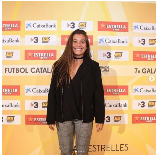
_mariallomp10 • Siguiendo Estrella Damm

_mariallomp10 Una experiencia vivida, y ojalá sean muchas más. Gracias a tod@s 🙌❤️! @fcf_cat