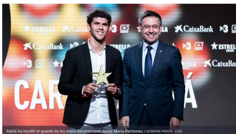
Aleñá ha recollit el guardó de les mans del president Josep Maria Bartomeu