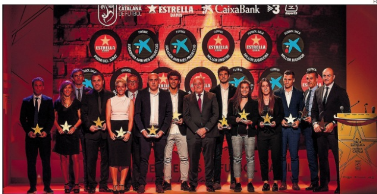
Tots els guardonats a la setena Gala de les Estrelles de la Federació Catalana de Futbol.