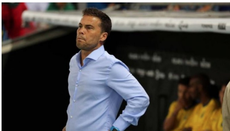
Joan Francesc Ferrer 'Rubi' escollit millor entrenador català de l'any passat

16/10/2018 19:40 | Actualitzat a 17/10/2018 11:40