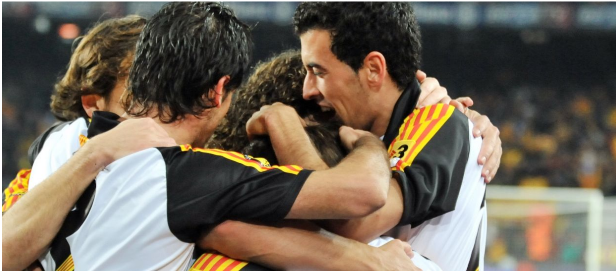
1903, L'ANY DE L'INICI

Una història de més de 120 anys que segueix viva a dia d'avui amb una llarga llista de partits internacionals